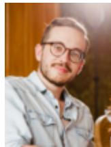
Ein Rezept von lawofbaking.com

Tipp: Man kann selbstverständlich nur Lisa oder Alex Cupcakes machen. Hierbei die jeweilige Menge der Milch verdoppeln und die andere natürlich weglassen. Ihr könnt eurer Kreativität hier freien Lauf lassen.