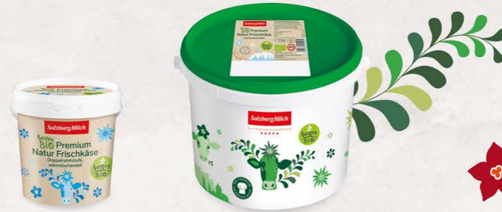
Art. Nr. 2770 Bio Frischkäse Natur 70 % F.I.T. 1 kg Eimer

Mit besten Kräutern verfeinert ist der Besser Bio-Doppelrahm Frischkäse Kräuter mit 65 % Fett i. Tr. bei einer Trockenmasse von 33 % ein wahrer Genuss.