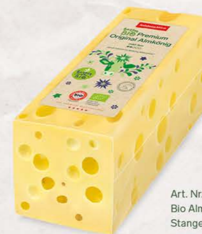
Art. Nr. 20276 Bio Almkönig 45 % F.I.T. Stange ca. 2,3 kg

der SalzburgMilch Bio Premium Almkönig ist immer ein wahres Käseschmankerl. Die Milch für die Produktion des Bio Almkönigs stammt von streng kontrollierten Bio-Bauernhöfen aus der Region.