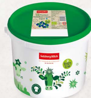
Art. Nr. 2997 Bio Heidelbeer-Cassis Jogurt 3,6 % Fett 5 kg Eimer mit Siegfelie