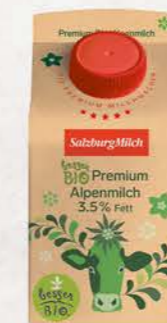
Art. Nr. 2894 Bio Alpenmilch 3,5 % Fett 500 ml