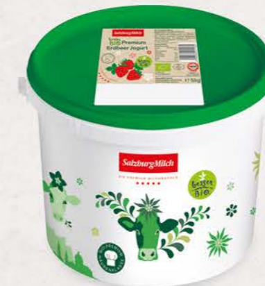
Art. Nr. 2992 Bio Erdbeere Jogurt 3,6 % Fett 5 kg Eimer mit Siegfelie