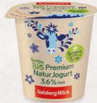
Art. Nr. 2606 Cremiges Bio Jogurt 3,6 % Fett 150 g Becher