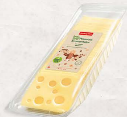
Art. Nr. 25044 Bio Emmentaler 45 % F.I.T. thermisiert Scheiben 800 g