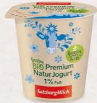
Art. Nr. 2605 Cremiges Bio Jogurt 1 % Fett 150 g Becher