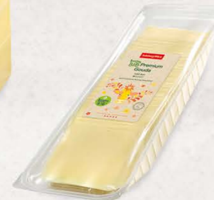
Art. Nr. 25043 Bio Gouda 50 % F.I.T. Scheiben 800 g