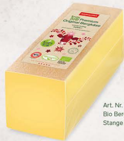
Art. Nr. 20290 Bio Bergkäse 50 % F.I.T. Stange ca. 2,6 kg

bauern lassen sich die Kühe im Sommer frisches Gras und im Winter sonnengetrocknetes Heu schmecken. Und gerade diese Bio-Heumilch verleiht diesem Käse seinen wunderbar g'schmackigen, würzigen Charakter.