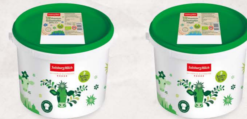
Art. Nr. 2944 Bio Speisetopfen 20 % F.I.T. 5 kg Eimer mit Siegfelle

Der SalzburgMilch Bio Premium Topfen aus kontrolliert biologischer Landwirtschaft ist mit seiner zart-geschmeidigen Konsistenz der pure Genuss. Zusätzlich zum Speisetopfen mit 20 % Fett ist der Bio Premium Topfen auch als Magertopfen erhältlich.