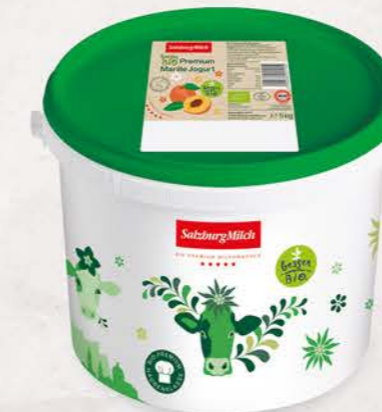
Art. Nr. 2993 Bio Marille Jogurt 3,6 % Fett 5 kg Eimer mit Siegfelie