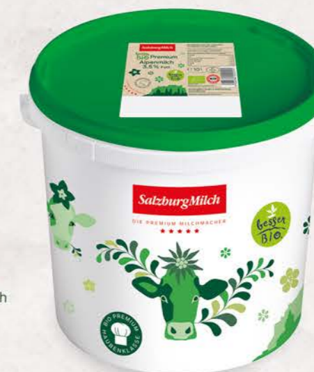
Art. Nr. 2920 Bio Alpenmilch 3,5 % Fett 10 lt Eimer mit Siegfelie