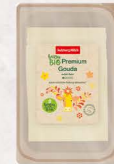
Art. Nr. 25042 Bio Gouda 50 % F.I.T. Scheiben 125 g