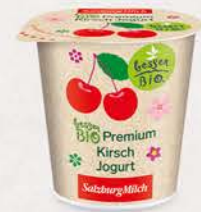
Art. Nr. 2654 Bio Kirsch Jogurt 3,6 % Fett 150 g Becher