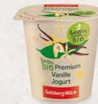
Art. Nr. 2655 Bio Vanille Jogurt 3,6 % Fett 150 g Becher