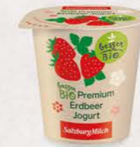
Art. Nr. 2652 Bio Erdbeer Jogurt 3,6 % Fett 150 g Becher