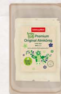
Art. Nr. 20206 Bio Almkönig 45 % F.I.T. Scheiben 125 g