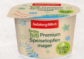
Art. Nr. 2947 Bio Speisetopfen mager 250 g Packung