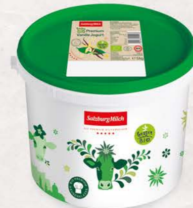
Art. Nr. 2994 Bio Vanille Jogurt 3,6 % Fett 5 kg Eimer mit Siegfelie