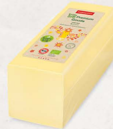
Art. Nr. 20277 Bio Gouda 50 % F.I.T. Stange ca. 2,6 kg

geschmeidige Käseteig hat den Gouda-typischen, angenehm milden Geschmack und eignet sich auch ideal zum Überbacken, Gratinieren und Verfeinern.