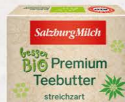
Art. Nr. 4166 Bio Portionsbutter 15 g Packungen