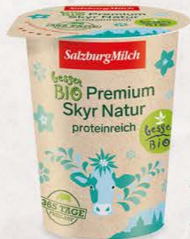
Art. Nr. 2772 Bio Skyr Natur 400 g Becher

Für die schonende Herstellung des Bio Premium Skyr verwendet SalzburgMilch beste österreichische Bio-Heumilch. Diese stammt von Kühen, die 365 Tage Freilauf im Jahr genießen. Der proteinreiche Bio Premium Skyr eignet sich nicht nur hervorragend als fettarmer Snack für Zwischendurch, sondern auch als Grundlage für ein Frühstücksmüsli oder zum Dippen.