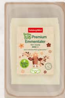
Art. Nr. 15040 Bio Emmentaler 45 % F.I.T. Scheiben 125 g