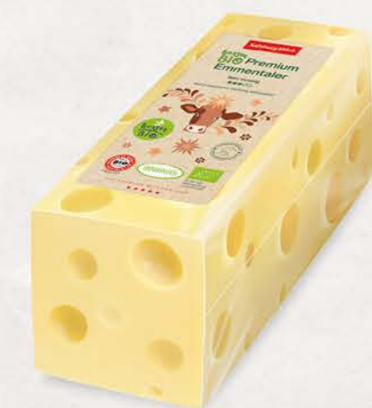
Art. Nr. 20291 Bio Emmentaler 45 % F.I.T. Stange ca. 2,2 kg

an Sorgfalt und Qualitätsbewusstsein wird die wertvolle Heumilch vom Käsemeister verkäst und danach mindestens 70 Tage bis zu ihrer Vollendung gereift. Besonders für die Weiterverarbeitung geeignet sind die Würfel des thermisierten Bio Emmentalers im 5 kg Beutel.