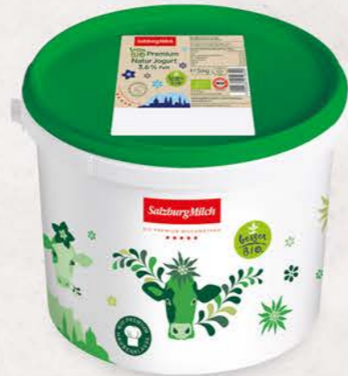
Art. Nr. 2891 Cremiges Bio Jogurt 3,6 % Fett 5 kg Eimer mit Siegfelie