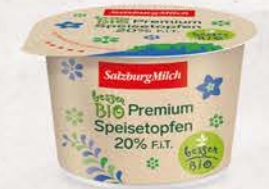
Art. Nr. 2948 Bio Speisetopfen 20 % F.I.T. 250 g Packung