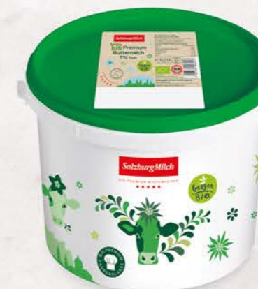
Art. Nr. 2893 Bio Buttermilch 1 % Fett 5 lt Eimer