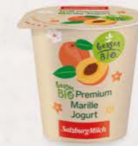
Art. Nr. 2653 Bio Marille Jogurt 3,6 % Fett 150 g Becher

150 g Becher erhältlich und sind besonders beliebt bei Buffets, in Schulen, Kindergärten, Seniorenheimen und Krankenhäusern.