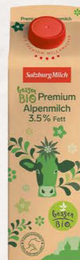
Art. Nr. 2906 Bio Alpenmilch 3,5 % Fett 1 lt

Natürlich nachhaltig und authentisch wird die SalzburgMilch Bio Premium Alpenmilch im umweltfreundlichen Getränkekarton verpackt. Der FSC zertifizierte, klimaneutrale Karton lässt sich besonders leicht falten und unterstreicht mit seiner charakteristischen braunen Kartonoptik den Bio-Charakter unserer Bio Premium Produkte.