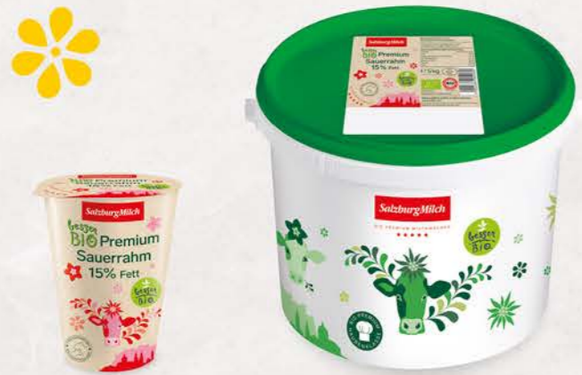
Art. Nr. 2900 Bio Sauerrahm 15 % Fett 200 g Becher

Der SalzburgMilch Bio Premium Sauerrahm ist der ideale „Helfer“ in der Küche, stichfest und leicht säuerlich im Geschmack. Er eignet sich besonders zum Verfeinern von Aufstrichen, Dressings, Suppen und Saucen.