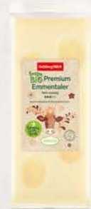
Art. Nr. 15035 Bio Emmentaler 45 % F.I.T. Stück 200 g