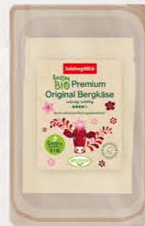
Art. Nr. 10523 Bio Bergkäse 50 % F.I.T. Scheiben 125 g