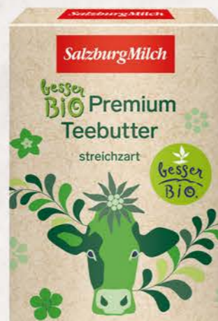
Art. Nr. 4163 Bio Teebutter 250 g Packung

100 % gentechnikfreie Biomilch aus kontrolliert biologischer Landwirtschaft ist die Basis für die SalzburgMilch Bio Premium Teebutter, die nicht nur besonders streichfähig ist, sondern auch durch ihren köstlichen, cremig-milden Geschmack überzeugt.