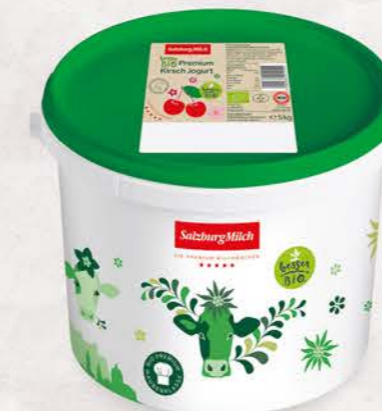
Art. Nr. 2995 Bio Kirsch Jogurt 3,6 % Fett 5 kg Eimer mit Siegfelie