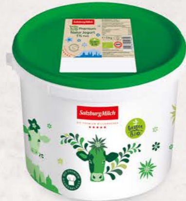
Art. Nr. 2924 Cremiges Bio Jogurt 1 % Fett 5 kg Eimer mit Siegfelie