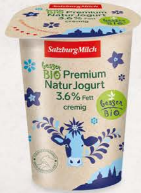
Art. Nr. 2958 Cremiges Bio Jogurt 3,6 % Fett 500 g Becher

vielfältig einsetzbar. Für den fettreduzierten Genuss gibt es das Bio Premium Naturjogurt auch mit 1 % Fett.