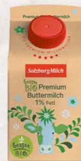
Art. Nr. 2892 Bio Buttermilch 1 % Fett 500 ml Packung

Dank ihres mild-säuerlichen Geschmacks und des geringen Fettanteils von nur 1 % schmeckt die SalzburgMilch Bio Premium Buttermilch besonders leicht und erfrischend.