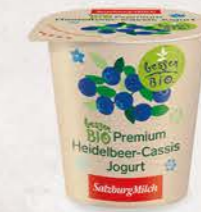
Art. Nr. 2656 Bio Heidelbeer-Cassis Jogurt 3,6 % Fett 150 g Becher