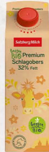
Art. Nr. 710 Bio ESL-Schlagobers 32 % Fett 1 ltr Packung

Ohne Stabilisatoren, aus dem Grund bitte vor Verwendung schütteln.