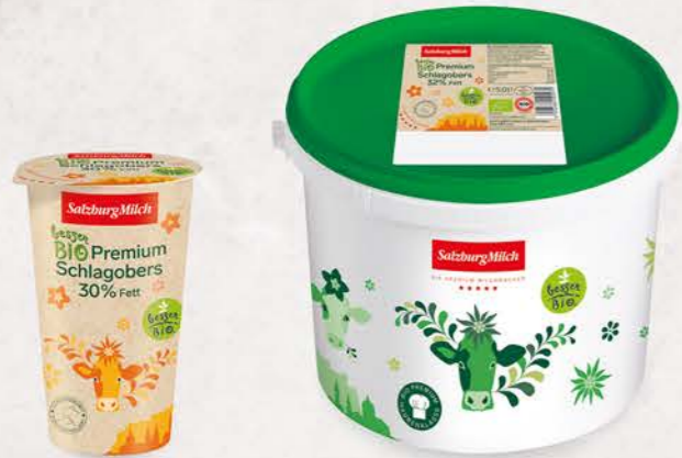
Art. Nr. 2901 Bio Schlagobers 30 % Fett 250 ml Becher

Mit seiner cremigen Konsistenz und seinem vollen Geschmack ist das SalzburgMilch Bio Premium Schlagobers die geschmackliche Krönung für jedes Gericht, egal ob für Hauptgerichte oder süße Desserts.